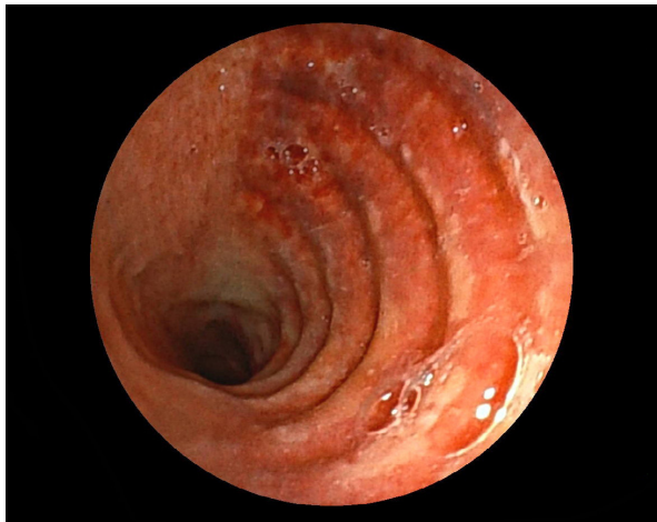
Akute Tracheitis nach Aspiration

Ein besonderer Schwerpunkt dieses Kurses liegt auf den praktischen Übungen in kleinen Gruppen, um Sie auf diese Weise zur sicheren und selbstständigen Durchführung einer Bronchoskopie zu befähigen.